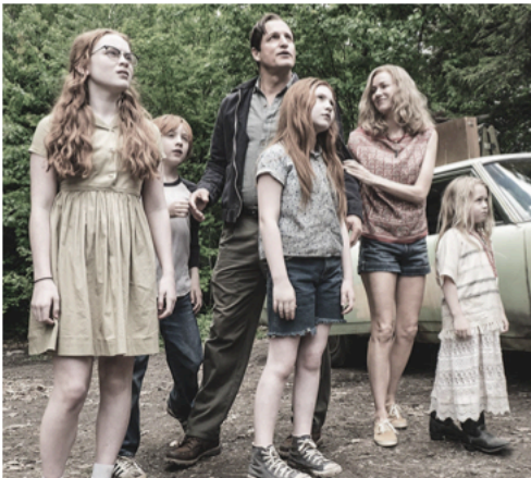
Sadie Sink (Lori), Charlie Shotwell (Brian), Eden G. Redfield (Maureen)